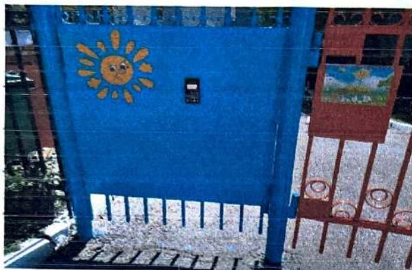
2 Главный вход (ширина проема 85 см., порог 15 мм.)