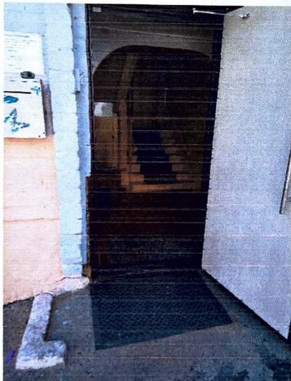
3. Пути движения к группе