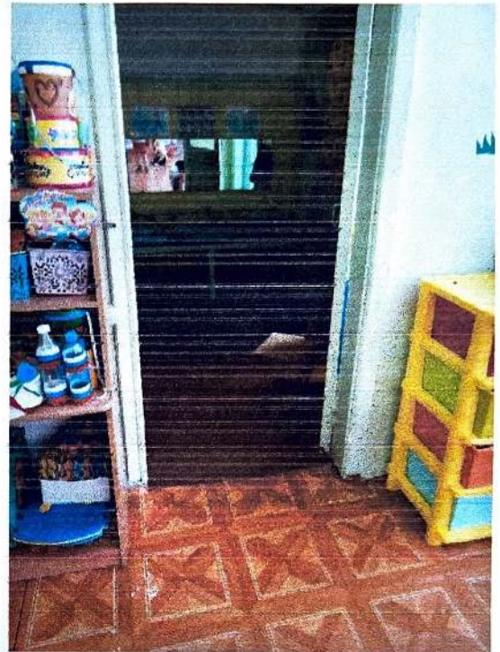
9. Вход в туалет (ширина проема 80 см)