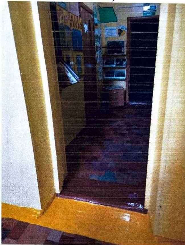
5. Вход в приемную (ширина проема 85см, порога 15 мм)