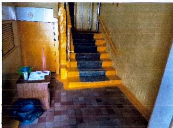
3. Пути движения к группе